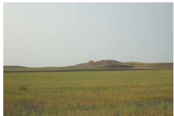
ショールトゥガイ遺跡