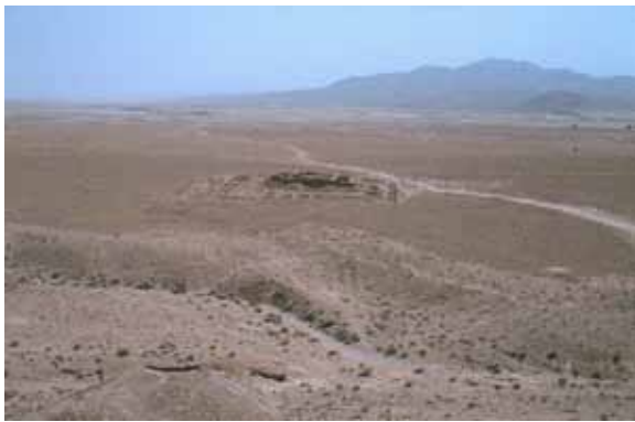
ムンディガク遺跡