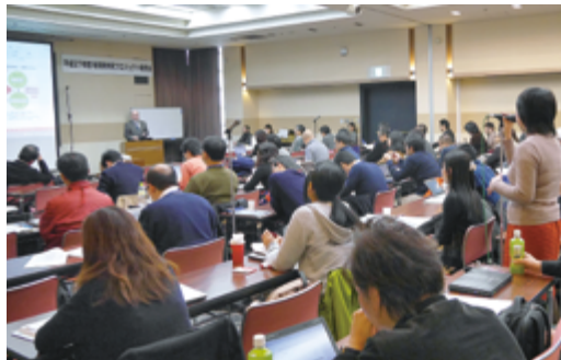
会場からの質疑をもとに活発な議論が展開しました

ました。加えて、来年度以降の第III期中期計画では、ほかのプロジェクトとの協同による「新しい地球環境学の構築」といった壮大な目標を掲げるので、そこにむかう道筋を質疑のなかから探ろうとしているようでもありました。