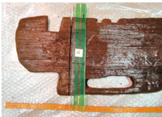
写真2 青森県青森市新田(1)遺跡から出土したアスナロ材

を調査し、29試料間の相対的年代関係を確定して、西暦680～1047年にわたる368年間の標準年輪曲線を構築しています。また、この標準年輪曲線に組み込むことができなかった試料の放射性炭素年代を測定し(14Cウィグルマッチング)、それらが西暦400～650年ごろの年輪をもつものであることも確認しています。