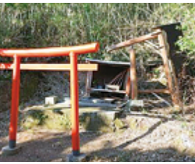
上: 台風15号により倒壊した恵比須神社 下: 倒壊した恵比須神社の周りから拾い 集められた棟札