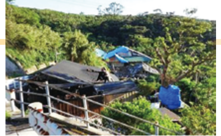
台風15号後の三島村黒島片泊地区のようす (2015年10月6日)

且つ家老・醫者を村里に巡察せしめ、飢えを救い病を治すと雖も、死者殆ど千人なり」(文化2年)という状況でした。