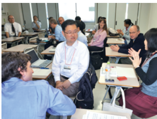
バイリンガルの外国人参加者の助けを借りて、日本語・英語の両方で議論が交わされました

この学会で、もう一つひじょうに深い感銘を受けたのは、2日目のエクスカーションでの瀬戸内海の離島・豊島 てしま への訪問です。産廃不法投棄の島として知られるこの島には、全国ネットの報道ではうかがうことのできない、地域住民の苦闘の歴史がありました。地域リーダーの一人が冷静に分析されるその長大な経験は、まさに環境史そのものであり、時代と地域を超えた研究の基点の一つになるものと感じられました。