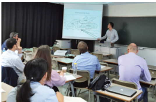
ラウンドテーブルセッションのようす