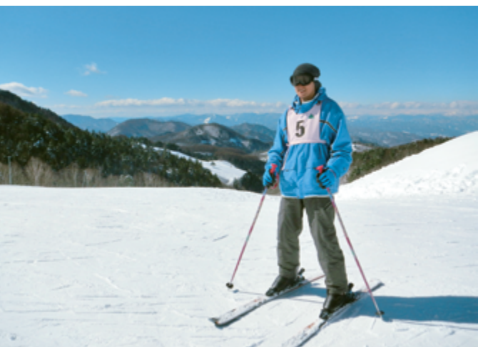
岐阜県高山市にてスキーを学ぶ(2012年2月)

During the last five years, I have unforgettable experiences in Japan. I got the PhD degree in Nagoya University, and my first baby was born in Nagoya, which is the happiest thing in my life. After I returned to China, I still remember five unforgettable years in Japan.