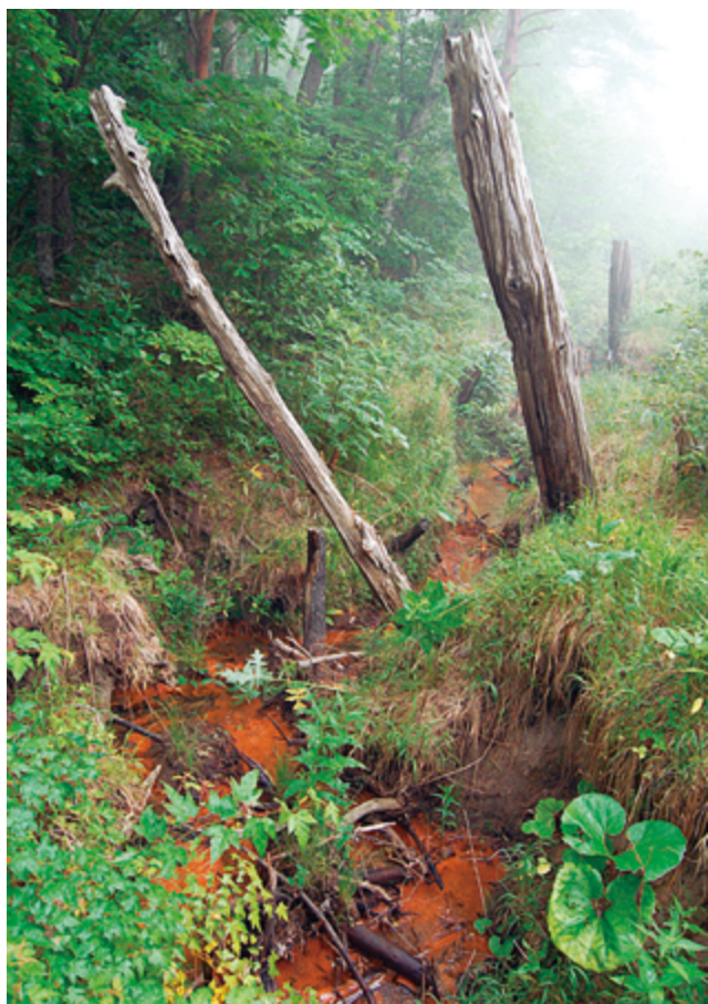
写真1 青森県下北半島太平洋沿岸にある猿ヶ森砂丘の埋没林

樹木年輪中のセルロースの酸素同位体比は、生育時の降水量・相対湿度によって規定されます。そのため、これを年輪気候学解析の説明変数として用いれば、過去の降水量・相対湿度の復元が可能となります。古気候学グループでは、日本列島の高分解能古気候復元を目的として、日本各地から木材試料を収集し、この年輪酸素同位体比の分析に取り組んでいます。すでに中部日本と南日本では、過去2,000年分のデータが得られており、両者の相違点を比較できる段階にきています。