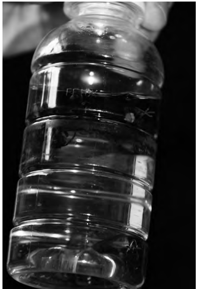
図 13 オオスズメバチの液浸標本