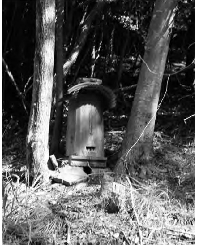
図10 対馬の伝統的な巣箱である蜂洞（ハチドウ）。 樹木の幹をくりぬいて作られる