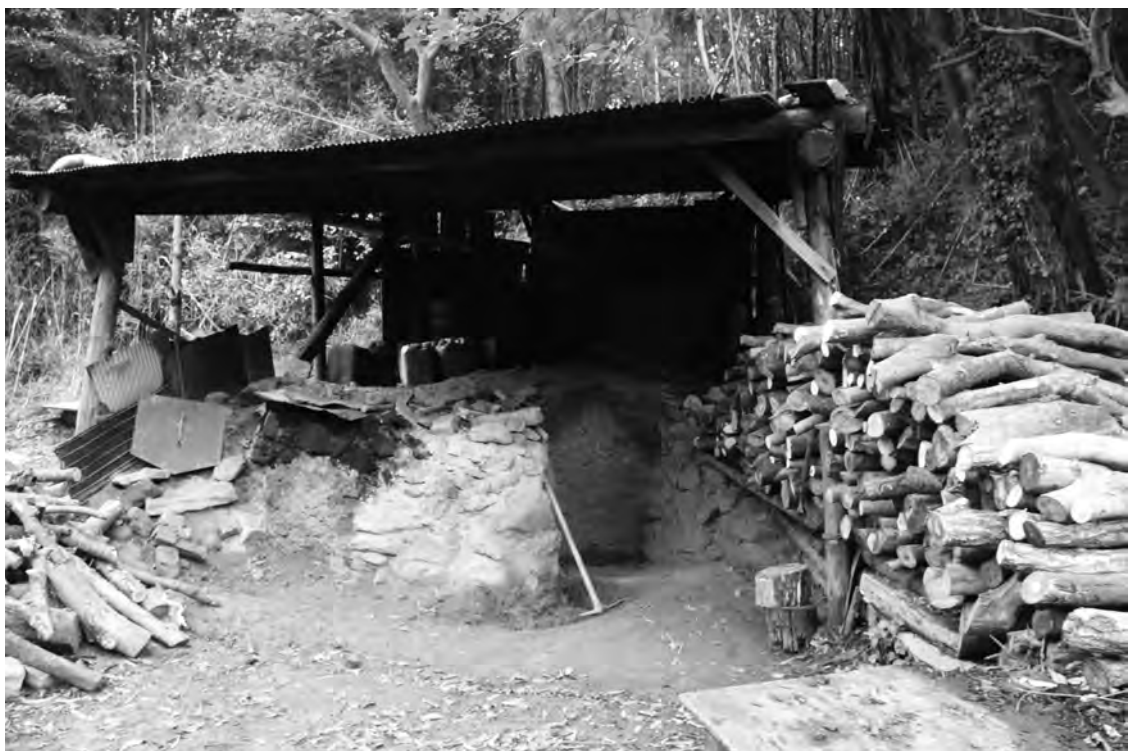
図4 炭焼き窯（対馬市厳原町内山）

扇：30年後の今も、1トン9千円。そんな感じだったら、生活できる単価じゃないけん、山もどんどん、