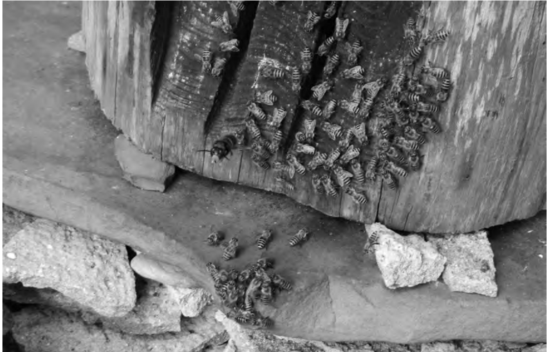
図9 ニホンミツバチの巣箱を襲うツマアカスズメバチ

スズメバチ。はあ、ろうは、蜜ろうを塗っとるけん、ろうを取りにくっとかなと思って。翌日も行ったら、またツマアカがもやもやする。そしたら、また行ったらミツバチがおるようになる。とぼおんと入り口、ツマアカがおらん、来とらんとき。ミツバチがおったとかってつって。