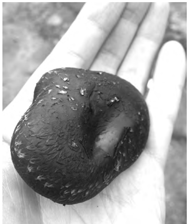
図7 シイタケの原木栽培（左）と生産物のシイタケ（右）。（対馬市厳原町内山）