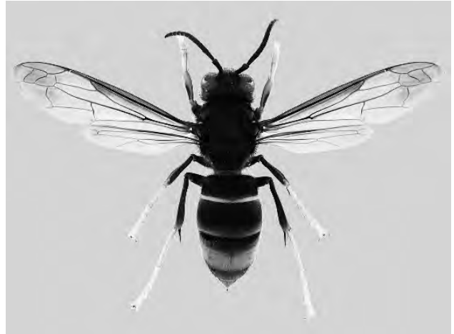
図 12 ツマアカスズメバチ ( Vespa velutina )

小林：高橋先生が。それはでも扇さんから、島の人からこういう問題が出てるっていうことを聞いて来られたんですか。