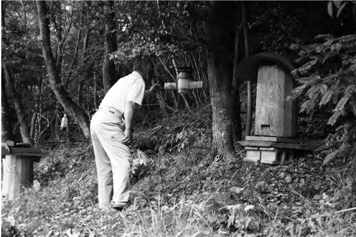
図 15 ツマアカスズメバチを捕獲・駆除するための「ツマアカ・トラップ」