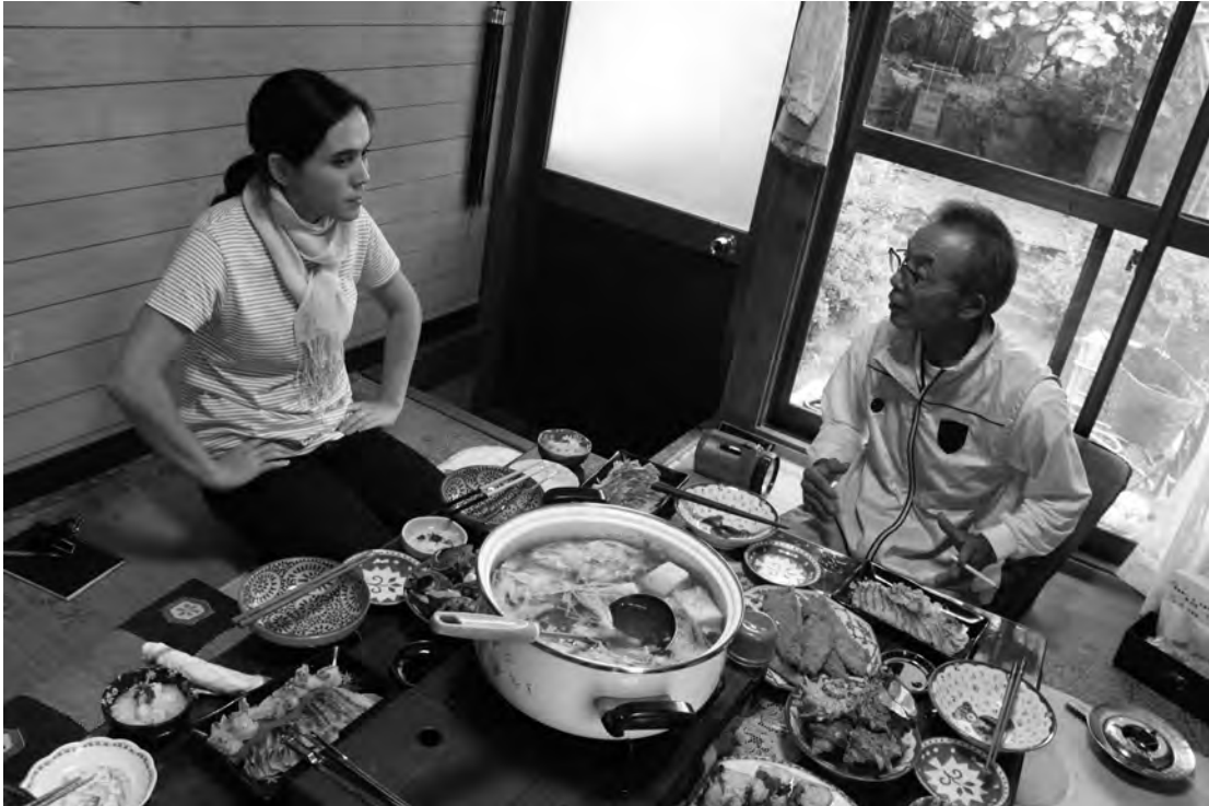
図5 対話は、お昼にも海の幸の食事をいただきながらも続いた

扇：アイゴ。それとかクロ 13 も入るし、ほから、ノコノハダイちゅうのが入るし、それからね。沖縄からやってきたブダイちゅうのがおった。ブダイ。アカブダイ、アオブダイつって。わたしが元気なときは、4キロ5キロっていう時代があった。沖縄の人、美味しいって食べよるけどさ、あれ、まったく美味しくない。もうカマボコにしても食べられんやった。美味しくなかった。