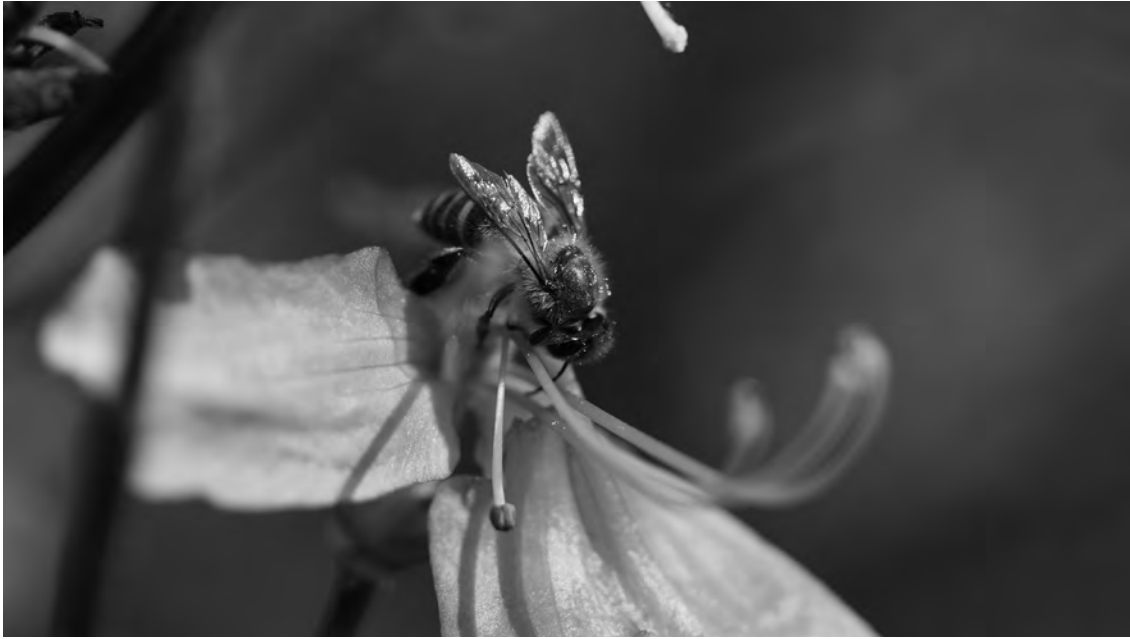
図8 ゲンカイツツジを訪花するニホンミツバチ

この狭いところやけど。ヤマザクラを。だから、植えるところあったら、苗やるよ、つって。仮植しとる苗が10本あまりあるから、そうも言う。だけど、いやあ、おれもハチ持ちちよるけ、1本植えよう言うの1人もおらん。