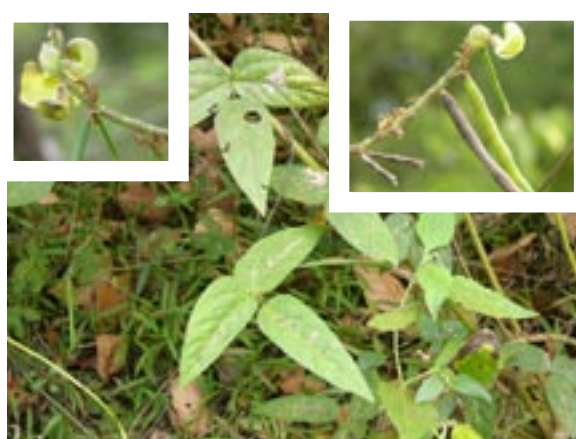
6. 2003L19 地点 (100m). 南ラオス・パクセ南部の V. minima . 花外蜜腺に赤い蟻が集まっている. 花や莢を害虫から守る働きがあると思われる.