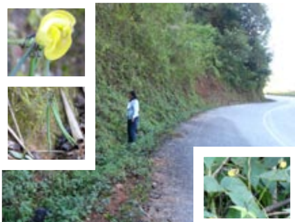
1. 2003L5 地点 (1115m). ルアンプラバン南部の山岳地帯. V. hirtella の生息地