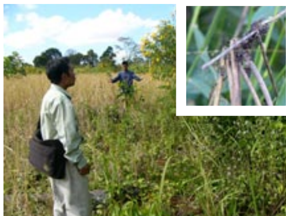
2. 2003L8 地点 (890m). 南ラオス・パクソン東部の陸稲畑横. V. hirtella と思われる集団の生息地