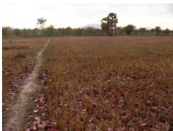
5. 2003L17 地点 (135m). 南ラオス・Khongsedonの水田二期作地帯. イネの収穫期には V. minima が畦をびっしり覆っていたという