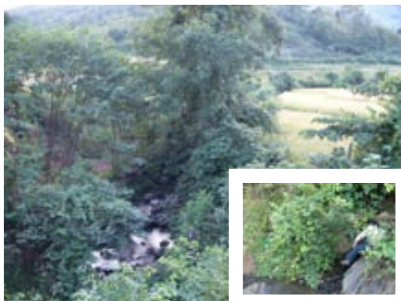
3. 2003L6,7 地点 (270m). ルアンプラバン北部水田地帯の河川脇. V. hirtella と V. reflexo-pilosa と思われる集団の生息地