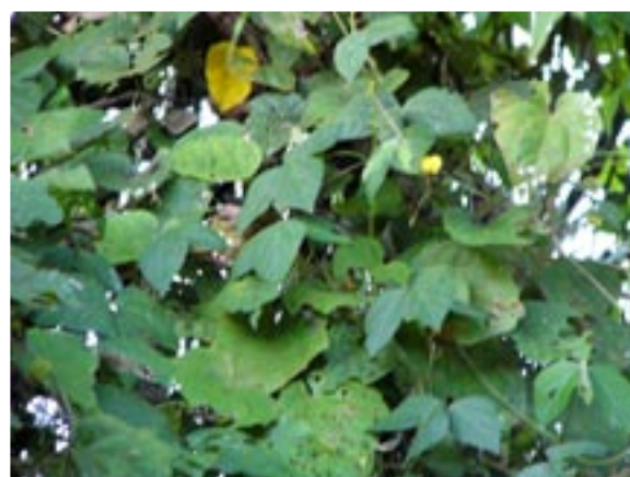
4. 2003L7 地点 (270m). 河川脇の樹木に巻き付いて生育する V. reflexo-pilosa と思われる集団. 東南アジア大陸部で初めての生きた材料