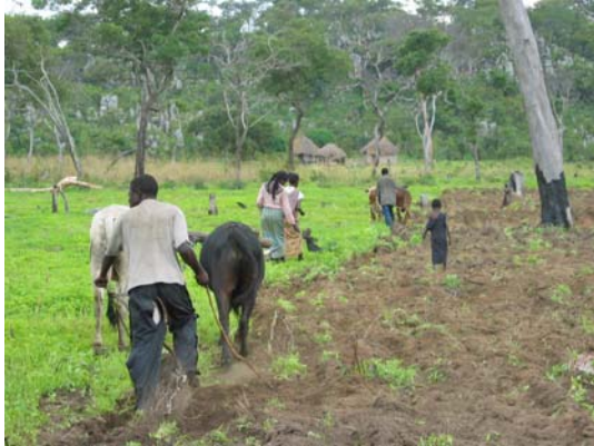
写真 6：拡大家族総出の耕起作業

耕作に切り替えた。それは、拡大家族内で起きている「過剰な死」の影響を、拡大家族内全体に波及させることを防ぐ効果は持っていたといえる。しかし、その後の経緯をみると、一部の「過剰な死」を抱える世帯はその後にも壮年者の死亡が続き、結局世帯としての農業生産が危ぶまれる状態になってきている。拡大家族単位の脆弱性緩和機能に依存できなくなった世帯の脆弱性は急速に悪化している。