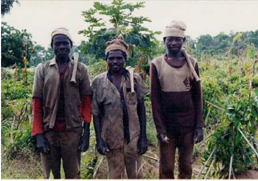
写真 1: 共同労働グループ