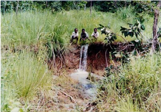
写真 2: 耕地に広がる浸食

棄するという対応策をとったが、すでに幾つかの畑は浸食が進んで耕作不可能になってしまった。