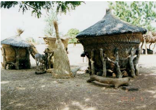
写真 3: Y 村の穀物倉庫

この調査地の概要については島田(2001)の論文で明らかにした。年間平均降水量が 700mm 前後でしかも年変動が大きいこの地域の農業は、モロコシとヒエが主穀であり、平年作の年でも翌年の収穫直前にミレットを購入している世帯が少なくなかった。(国際農林水産業研究センター 2000)例えば 1998 年、32 戸の内 27 戸が「平年作以上」であったと評