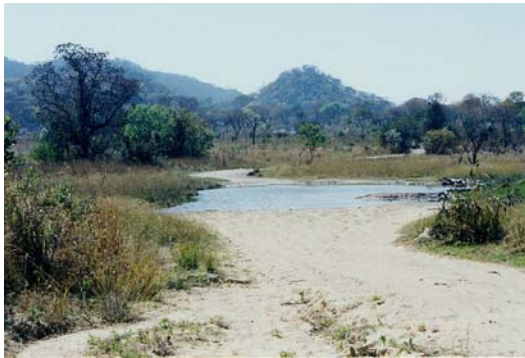
写真 4: 森林保護区のみオンボ林

この噂を根拠に多くの人々が森林保護区内に入って行った。国の森林保護政策に変更はなかったが、この森林保護区の森は瞬く間に伐採され、2006年に訪問したときには、岩山と一部の平地を残しほとんどが耕地となっていた。森林保護区内への入植と開墾は、首長の任命を受けた村長の差配のもとで秩序立って行われた。入植者たちは、森林保護区で新しく村長になった人たちに入村料なるものを支払っていた。おそらく、村長たちも首長に何がしかの許可料を支払っていたと思われる 6) 。