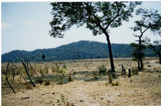
写真 5: 「開拓」された森林保護区

C村からも、もっと大きな耕地や換金作物生産に有利な低湿地(ダンボと呼ぶ)を求める農民たちが多くこの森に入っていった。1995年の2代目村長の死もこの動きに拍車をかけた。村長の死は土地の汚れや地力の衰えを示すとの理由で、あるいは新村長の自民族(レンジェ)中心主義を嫌って何人もの村人が森林保護区に移っていった。