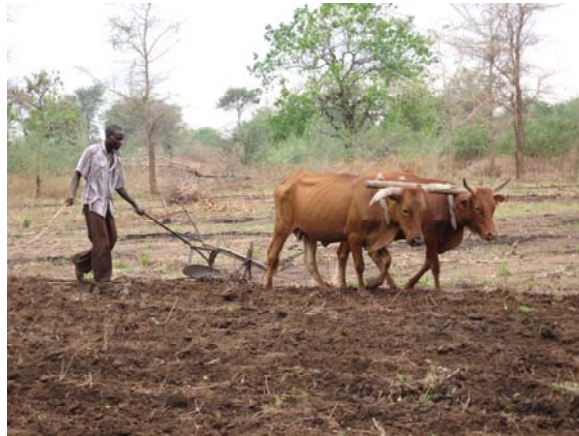
写真1 トウモロコシ畑の牛耕