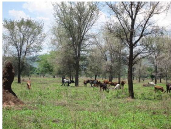
写真2 収穫後のトウモロコシ畑でのウシの放牧 (点在する樹木はアカシア・アルビダ)