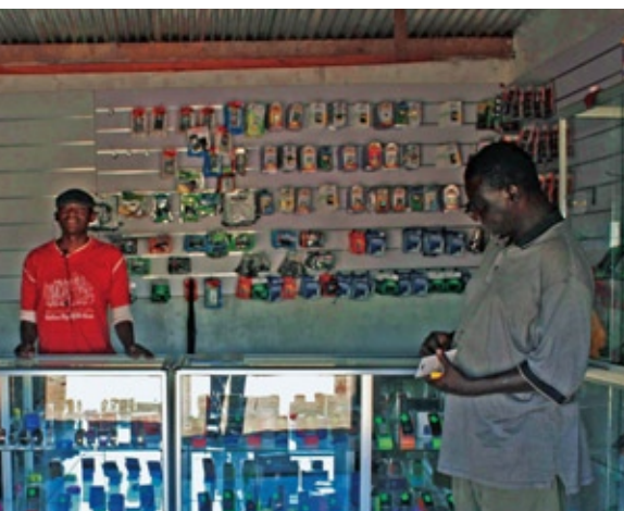
地方の町の携帯電話販売店。都会的な華やかさがあり、人びとをひきつける

専門は生態人類学。研究プロジェクト「社会・生態システムの脆弱性とレジリエンス」プロジェクト研究員。2008年から現職。