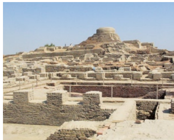
モヘンジョ・ダロ 丘の上のドーム状の建物は後世の仏塔(ストゥーパ)とみなされている

境が悪くなり、そこに住んでいた人がインド側に移住していったことで、しだいにネットワークが崩れていった。これが有力な説だと考えています。