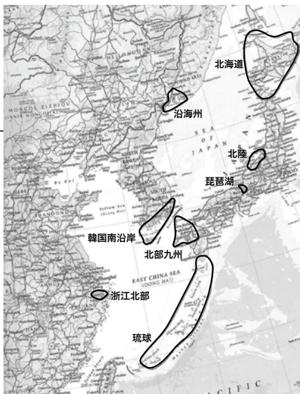
東アジア内海の8調査地域

て扱われている点です。いっぽう、プロジェクト発表会などでは、自然への意識を取り戻すべきだという点が強調されている印象があります。このギャップはどこからくるのでしょうか。