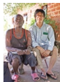
聞き取りの途中で休憩する筆者と調査助手

調査を通し、「ワン切り」がなぜ頻繁に行なわれるか頭では理解できた。しかし、「ワン切り」を受けると、ムッとしてしまう自分ときおり気づく。彼らのしたたかな感性に追いつくことは容易でない。