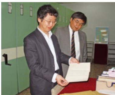
紫禁城の西華門に位置する中国第一歴史檔案館の地下保管室にて

私はユーラシアの歴史を研究しています。16世紀から現在に至るまでのユーラシア中央域の自然と人間の歴史研究は、これまでほとんど手つかずでした。その