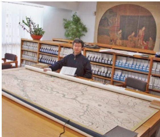
台北国立故宮博物院所蔵の未解読の古地図を解読しています。この作業は17世紀におけるユーラシア東西の地理調査の実態を解明するきっかけにもなりました

「聞くところによれば、東北三省の人びとは毎年松の実を、一本の木をまるごと切り倒して採っているという。木に生えた松かさが多ければそれでよいが、一本の木に生えた松かさが少ないのであれば、どうして木に登って採るという方法をとらないのか。人びとはこれまでずっと木を切り倒して松かさを採ってきた