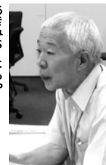
あさみち・ともや 専門は生態人類学。研究推進戦略センターネットワーク拠点形成オーガナイザー。二〇一一年から現職。