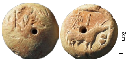
カーンメール遺跡から発掘したインダス印章ペンダント 表面(右)に印影。裏面(左)にインダス文字が刻まれている