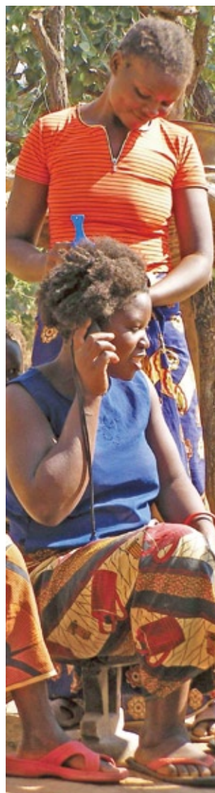
髪を結われている最中に携帯電話で会話するザンビア南部州の農村女性

し始めたザンビア農村では、困窮した農民がみずからの携帯電話を用いて(もしくは隣人に借りて)、都市部の血縁者に現金や食料の無心を行なっていることが明らかになった。