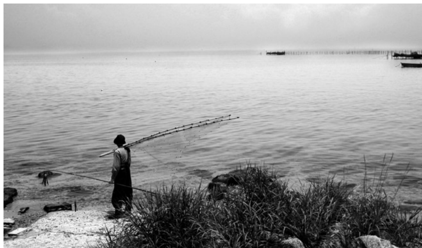
琵琶湖 景観は、歴史的に日常生活のもとで作られる

いっぽう、ユーラシアにはほかにも、西に地中海、そして北海・バルト海をあわせた「北ヨーロッパ内海」の二つの温帯内海があります。そこで、よく研究されているこれらの内海を参考に、東アジア