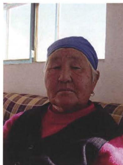
マーモーハイさん