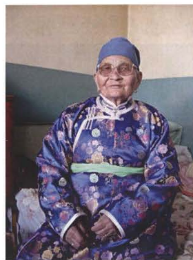
ドルマジャブさん